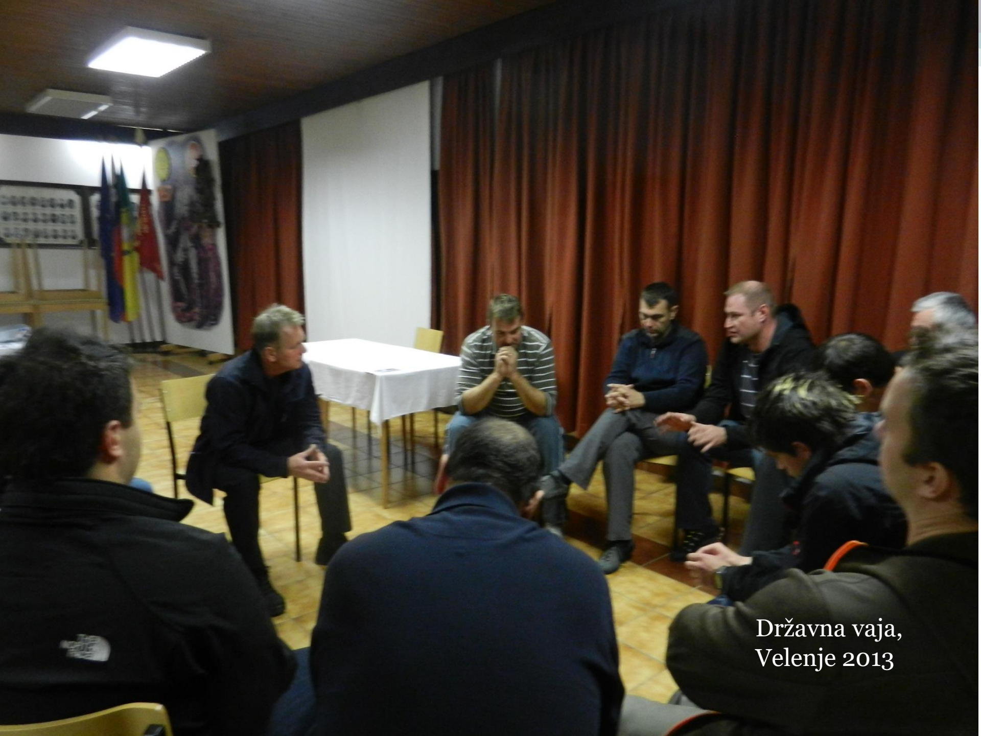
Državna vaja, Velenje 2013